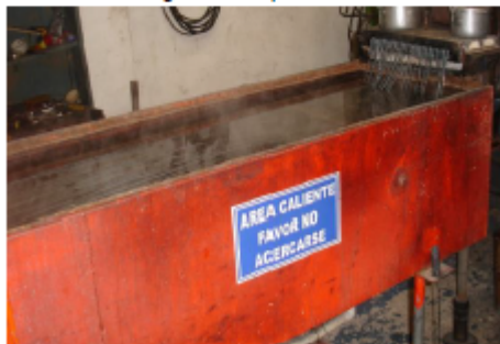
Fotografía 5. Inyección