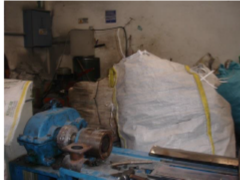
Fotografía 1 y 2. Lonas con bolsas plásticas