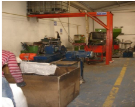
Fotografía 3. Máquina moledora