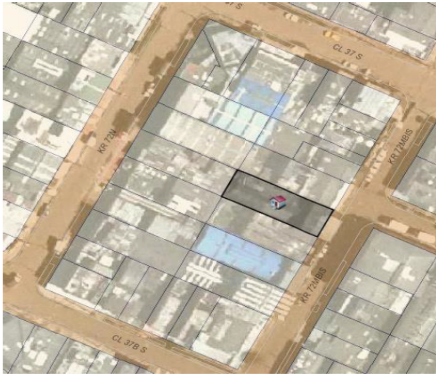
Imagen 1. Imagen del predio