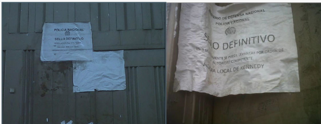
Foto No. 1. Sello en portón de la empresa.

Dentro de los radicados de la referencia, se presenta los resultados de la caracterización realizada dentro del programa de monitoreo de efluentes y afluentes fase 10, el cual se evaluará en el punto 4.1.3, sin embargo dentro de este radicado se hace la referencia que se encontró un sello, la visita no fue atendida.