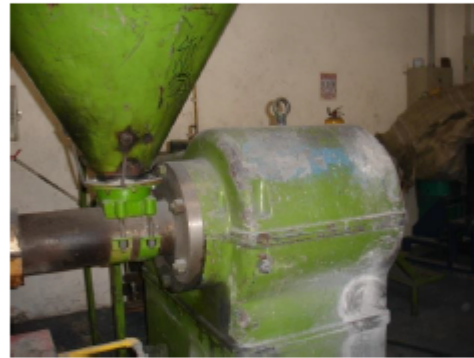
Fotografía 4. Tolva.