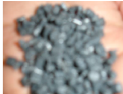
Fotografía 5. Producto terminado